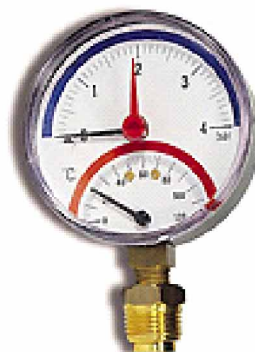
Термоманометр TMRA (радиальное подключение)